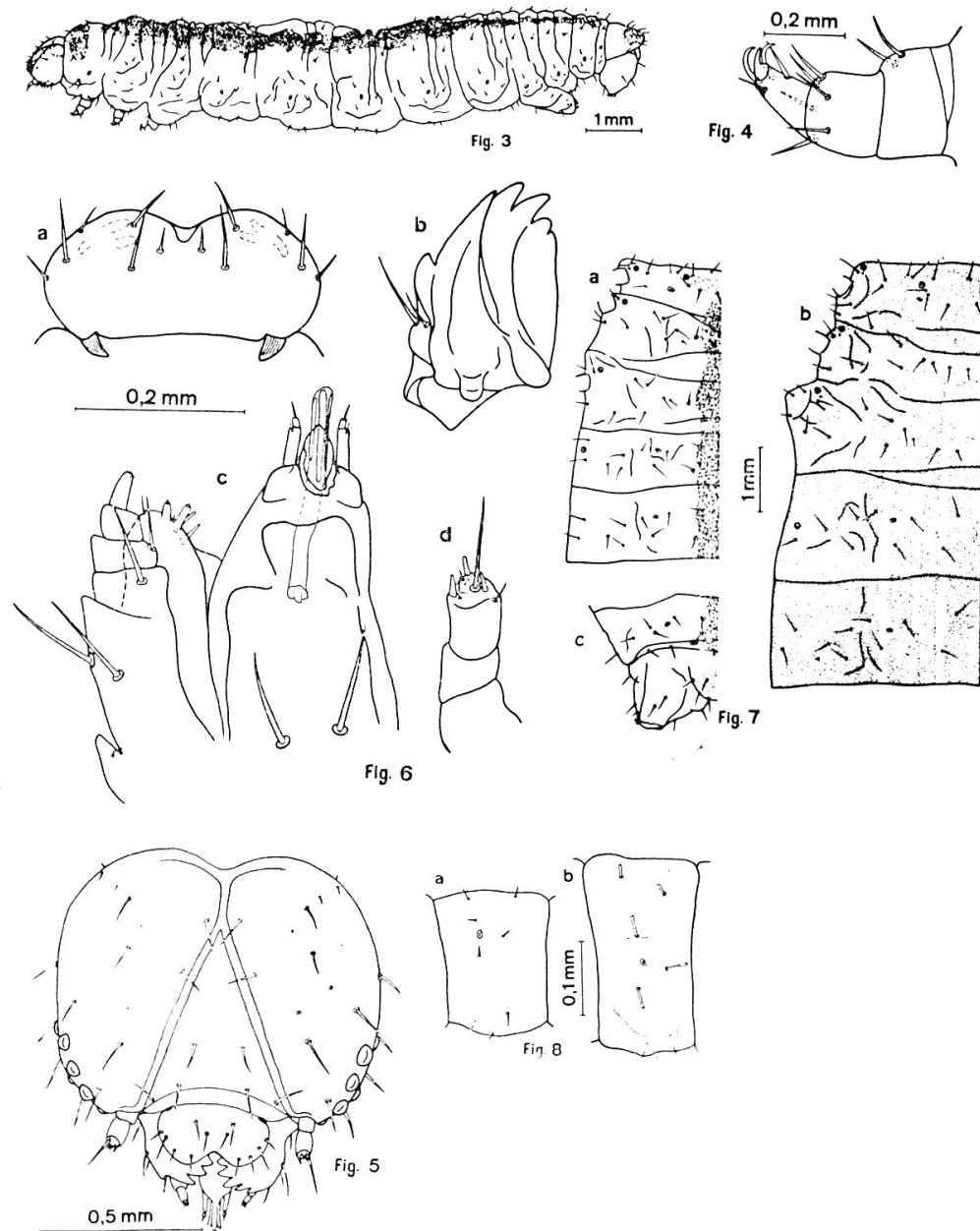
Fig. 3. Chl. rectangulata L., larve adulte.