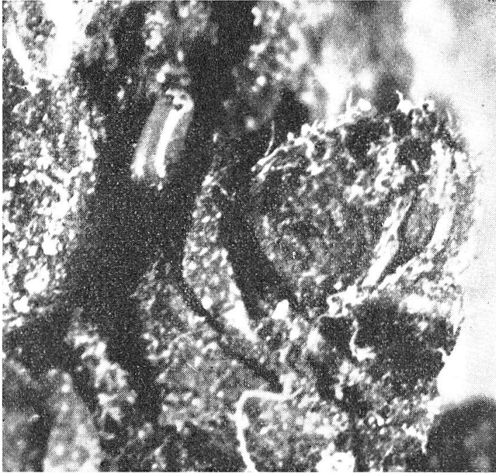
Fig. 1. Chl. rectangularata L., œuf isolé, caché derrière un vieux bourgeon 1 (agr. 22 ×).