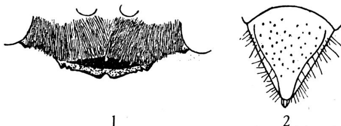
Fig. 1 et 2. — Tachysphex sordidus Dahlb. ♀. 1. Clypéus. 2. Aire pygidiale.

crure nette au milieu et une petite dent près des angles latéraux, eux-mêmes saillants (fig. 1). 2 e et 3 e articles du funicule 3 fois plus longs que larges. Ponctuation de la face fine et dense, les espaces plus petits que les points. Distance interoculaire au vertex un peu plus grande que