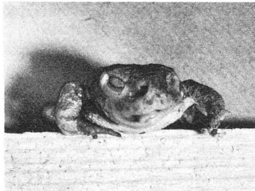
Abb. 1. — Lucilia Befall an Anuren. Oben : Bufo bufo mit Lucilia Gelege. Unten links : Alytes obstetricans 1. Fall, Aufn. am 30.VIII.; Kopfregion durch die Larven ausgehöhlt. Unten rechts : Bufo calamita mit erweiterten Nasenhöhlen.

wo sie in einem halbdunkeln Raum bei 12–15°C überwintert werden. Sie sind am 4. XI. noch nicht verpuppt. Zwischen 4. V. und 15. V. 66. schlüpfen 4 Fliegen; zwischen 7. V. und 11. V. legen 2 Fliegen Eier an Rindfleisch; am 19. V. sind Larven zweier Grössenklassen am Fleisch.