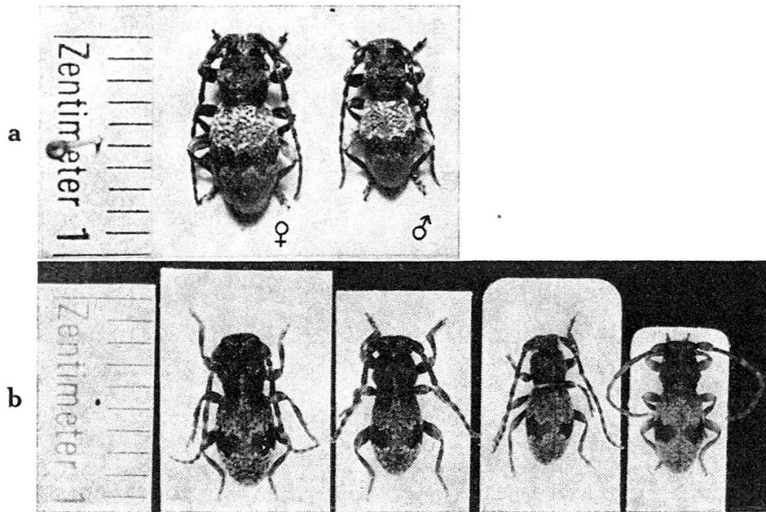
Abb. 1. — a, Parmena balteus L. ; b, Parmena interruptus PIC

Binde durchquert werden, die meistens die Naht erreicht. Ohne sie zu nennen, spielt PLANET auf die v. interruptus PIC an. (Abb. 1.)