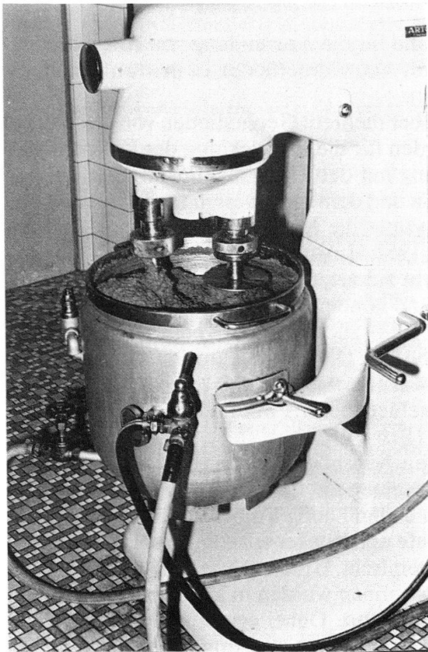
Abb. 1: Zubereitung des Nährbodens; Planetenrührwerk mit 60 Liter Doppelwandkessel für Dampfheizung.

Die Zusammensetzung der beiden von uns verwendeten Nährböden ist in Tab. 1 enthalten. Beim Nährboden 1 handelt es sich im wesentlichen um denjeni-