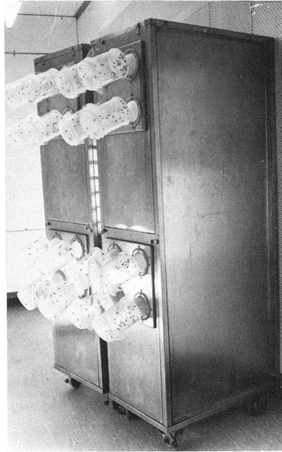
Abb. 4: Schlüpfen der Falter. Die Falter sammeln sich in den über die Plastiktrichter gestülpten Dosen.

Die Nährbodenschalen werden in fahrbaren Chromstahlgestellen (180 x 60 x 40 cm) gehalten (Abb. 3). Bei Beginn des Falterschlüpfens werden diese Gestelle seitlich mit Blechwänden geschlossen. Die Hinterseite wird zur Ermöglichung der Ventilation mit einem engmaschigen Gitter versehen, und die Gestelle werden dicht an die Zellenwände geschoben. Die Vorderwand besitzt 8 mit Plastiktrichtern versehene Öffnungen, durch welche die schlüpfenden Falter ausfliegen und sich in den Plastikbüchsen ansammeln (Abb. 4).