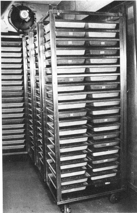
Abb. 3: Blick in die Zuchtkammer für die Raupenentwicklung. Fahrbares Chromstahlgestelle mit den mit Nährboden gefüllten Schalen.

ner Geschwindigkeit von 5–10 cm/sec über die Nährbodenoberfläche. Zudem wird den Zuchträumen alle 6 Stunden für eine halbe Stunde filtrierte Frischluft zugeführt (20 m 3 /Std).