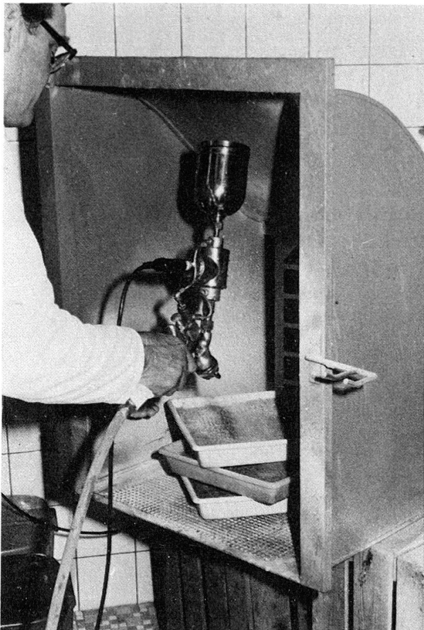
Abb. 2: Paraffinierung des in die Schalen eingefüllten Nährbodens.