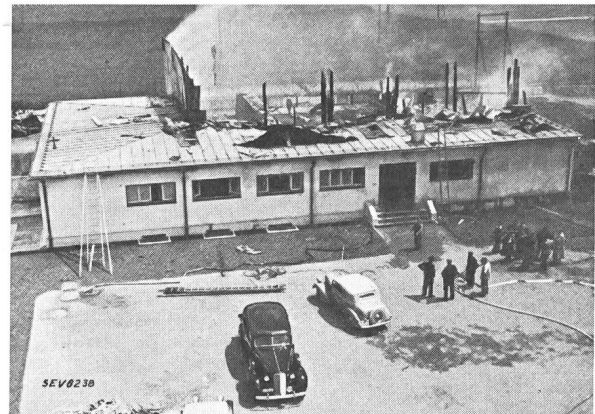
Fig. 2. Brand des Kurzwellensenders Schwarzenburg. Gesamtansicht. 6. Juli 1939.

Zu den Kontrollpflichten der Ueberwachung nach Emissionsschluss gehört u. a. die sorgfältige Ueberprüfung aller in der gefährdeten Zone (im vorliegenden Fall also hauptsächlich das Transformatorpodest und die Antennenzuleitung) gelegenen Anlagenteile. Diese Kontrolle wurde auch in der kritischen Nacht ausgeführt und ergab keinerlei abnormale Feststellungen.