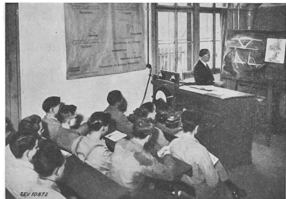
Fig. 1. Theoriestunde

ärgert, benützten die Handwerker oft nur noch zur Not die Elektroschweissapparate. Ein gewisses Misstrauen gegen dieses Schweissverfahren wollte Platz greifen. Diese Erscheinung war dem Umstand zuzuschreiben, dass der Maschinenverkäufer dem Benutzer in einem kurzen Vorführungsschweissen den Apparat wohl erklärt und vordemonstriert hatte, dann aber blieb der Käufer sich selbst überlassen. Je nach Können oder Selbststudium konnte er nun den teuer gekauften Apparat mehr oder weniger gut anwenden. Schweissen muss man lernen und lehren, und zwar nicht vom Nebenmann, der oft auch keine methodische Anleitung erfahren hat.