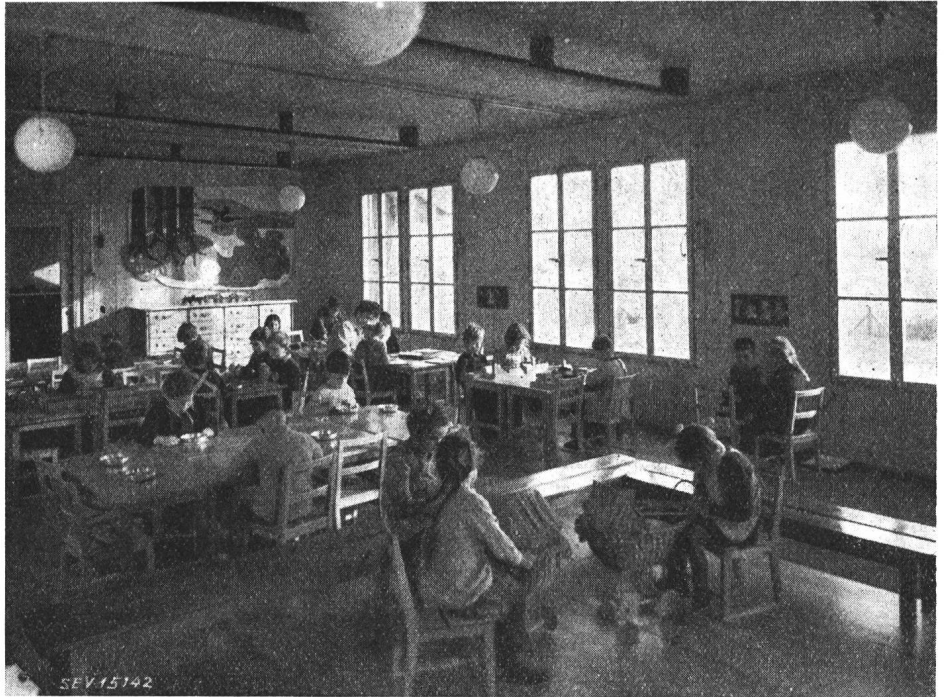
Fig. 1 Schulstube des Kindergartens in Riehen (BS) An der Decke sichtbar drei der insgesamt vier Strahlungsheizkörper

Anschlusswert. In diesem Falle beträgt die Heizleistung 1,25 kW, entsprechend einem spezifischen Wert von 43 W/m 3 .