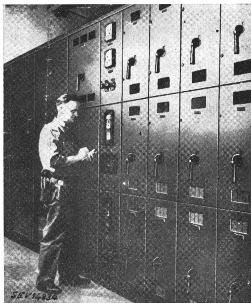
Fig. 10 Verteilanlage für Innenraum, aus vorgefertigten Schalteinheiten zusammengesetzt

Die gleiche Vereinfachungstendenz hat sich auch im Ausbau der Innenanlagen durchgesetzt. Hiefür stehen ebenfalls die fertig vorgefertigten Einheits-schaltkästen zur Verfügung, die je nach Erfordernis zusammengesetzt werden können. Wie Fig. 10 zeigt, ergibt sich dadurch eine einfache Montage und gute Erweiterungsmöglichkeit. In den ganzfeldrigen Kästen links befinden sich der Transformator und die Hochspannungsapparate, dann folgen das Sekundärmeßfeld mit Amperemetern und