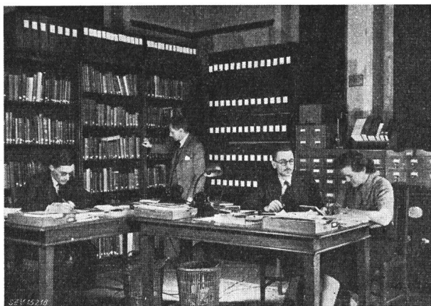
Fig. 1 Eine Ecke im Informationsbüro der ERA mit der umfangreichen Kartothek

Fig. 1 zeigt einen Ausschnitt aus dem Informationsbureau mit dem wissenschaftlichen und technischen Index, der allen Mitgliedern selbst über das Telefon zur Verfügung steht und über 35 000 verschiedene Artikel und Sachgebiete enthält.