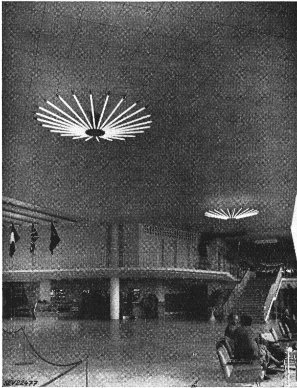
Fig. 3 Grosse Halle des Flughafens Kloten erbaut 1952/53

Entwerfer hinsichtlich der Wahl des Materials und in der Formung einigermassen gebunden; immerhin hat er die Aufgabe so anzupacken, dass er aus seiner Kenntnis der Materie heraus den Architekten auf mögliche Baustoffe aufmerksam macht, die diesem vielleicht nicht bekannt sein können, und aus seiner eigenen Betrachtungsweise Form und Gestalt zu suchen, um diese schliesslich in freier Aussprache