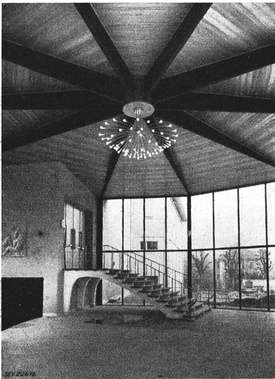
Fig. 2 Kurtheater erbaut 1952/53

Plastiken unauffällig ins Licht gerückt und gleichzeitig deren Wirkung und Betrachtung durch keine Fremdkörper gestört werden. Ein anschaulich gearbeitetes Modell lässt die etwas heikle Frage soweit entscheiden: Lichtquellen in die Zimmerdecken einzubauen, deren Öffnungen durch Gläser abgedeckt werden, die optisch so bearbeitet sind, dass die Lichtstrahlen durch Brechung bevorzugt an die Wände geworfen werden. Dieser Entscheid war aus baulichen Gründen frühzeitig zu fällen. Das Resultat hat die Zweckmässigkeit dieses Vorgehens bestätigt, wobei hinzuzufügen ist, dass heikle Aufgaben wie diese von der Nachprüfung der Modellversuche durch Proben am Bau selbst nicht entheben.