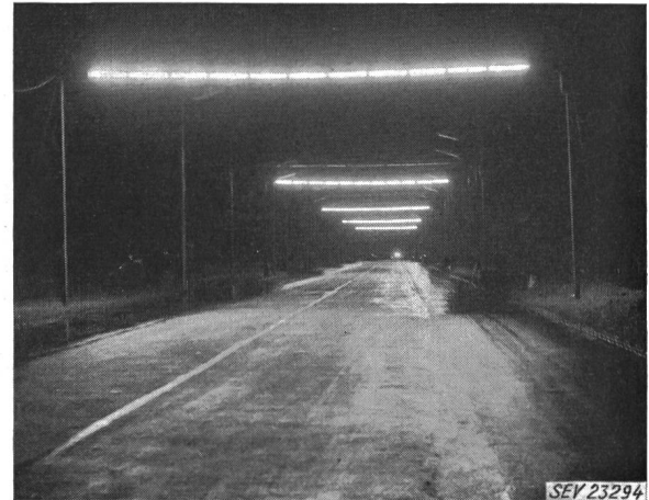
Fig. 2 Versuchsstrecke bei Amsterdam Linienbeleuchtung bestehend aus je 11 Fluoreszenzlampen 40 W Abstand der Lichtlinien 75 m; nasse Strassendecke

Zunächst versuchte man, diesem Umstand dadurch Rechnung zu tragen, dass der normale Abstand nicht in der Richtung der Strasse gemessen wurde, sondern als Diagonale von Lichtpunkt zu Lichtpunkt (Zickzackanordnung).