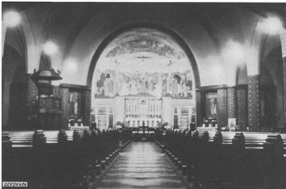
Fig. 6 St.-Pauls-Kirche

In enger Zusammenarbeit mit den Kirchenbehörden und den Architekten wird aber stets versucht, die technische Denkweise, die Art der Auffassung und die Maßstäbe der Lichttechnik auf die Architektur zu übertragen. Das Ziel ist dabei, der jedem