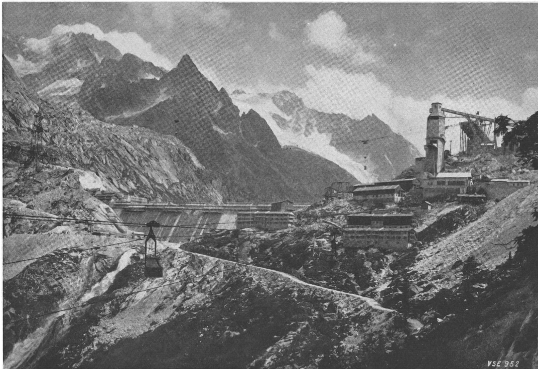
Fig. 1 Staumauer Albigna

im Val Forno und dem ebenfalls nach Murtaira führenden Druckstollen, sowie dem für das Wasser aus dem Fornogebiet separat gebauten Druckschacht nach der Zentrale Löbbia sind auch praktisch abgeschlossen.