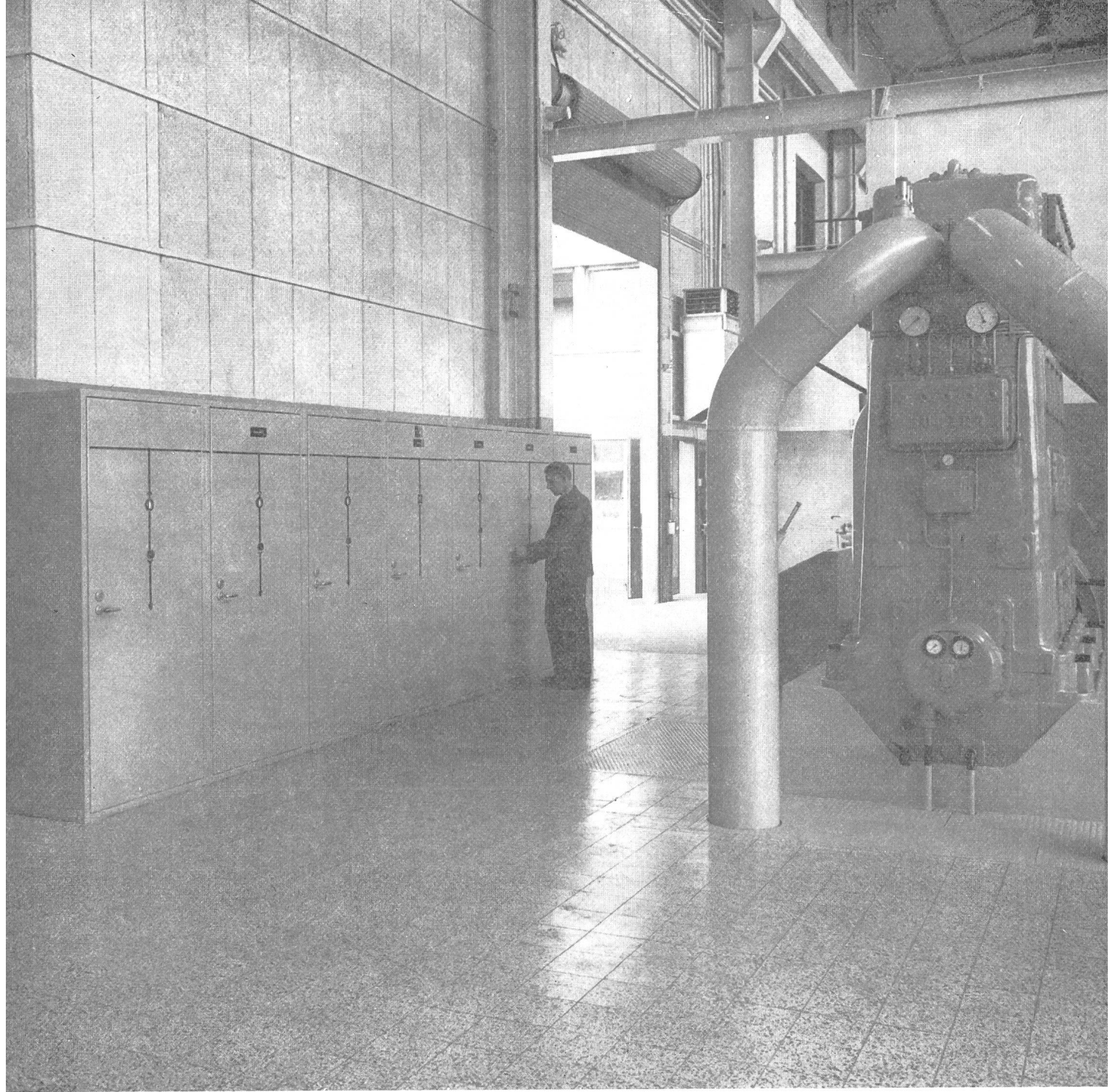
▲ 10-kV-Innenraum-Blockstation für Kompressorenanlage Gebr. Sulzer AG., Oberwinterthur

Wir liefern aus unserer Schalttafelabrik: