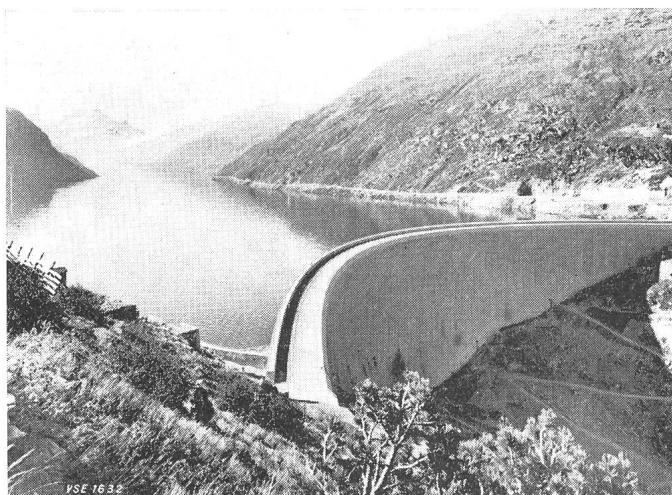
Fig. 1 Staumauer und Stausee Valle di Lei

Die Baukosten betragen rund 620 Millionen Franken. Es sind darin Ausgaben enthalten, die der Bevölkerung des Gebirgskantons Graubünden unbestreitbar grosse Hilfe gebracht haben. Eine dauernde Hilfe an die Konzessionsgemeinden bilden die Lieferung von Gratis- und Vorzugsenergie, die Wasserzinse von jährlich rund 1,1 Millionen Franken und die Wasserwerk- und ordentlichen Steuern von jährlich rund 3...4 Millionen Franken.»