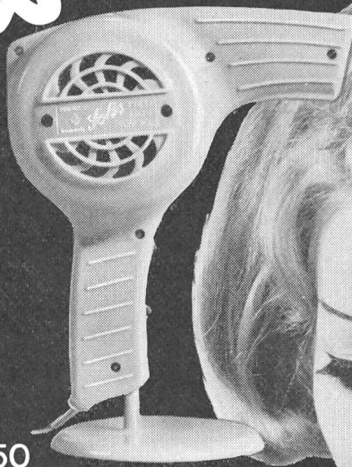
Nr. 54 Fr. 39.50