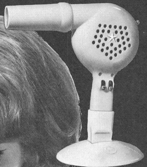
Nr. 105 Fr. 51.-

Für einen guten Haartrocknerverkauf brauchen Sie nur SOLIS!