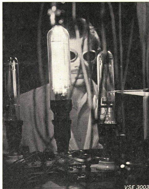
Filmsequenz: Strom lässt sich einwandfrei umwandeln