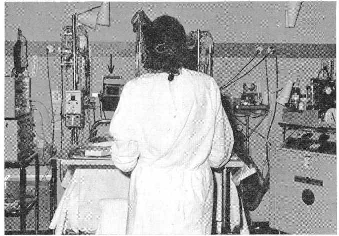
Fig. 3 Schwester am Protokolltisch, beim Fussende eines Patientenbettes, in der Intensivstation. Die meisten Anzeigen sind zu klein, insbesondere kann das EKG (Pfeil) nicht klar erkannt werden. Die Technik dominiert den Arbeitsplatz

Rasche, sichere Wahrnehmung von auf Anzeigegegeräten dargestellten Daten ist die Grundlage zu deren fehlerfreien