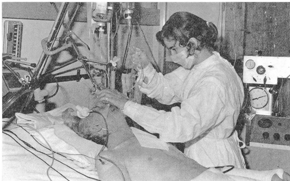
Fig. 2 Die Pflegerin ist grösstenteils allein mit Patient und Geräten. Sie ist durch pflegerische, medizinische und soziale Aufgaben ausgelastet. Alle technischen Aufgaben bedeuten eine zusätzliche Belastung

Es fehlt sicher auch an der Rückmeldung. Viel zu wenig Informationen über Gebrauchsfähigkeit und Bewährung der Geräte fliessen vom Benutzer zum Produzenten und seinen Ingenieuren. Dies mag zum Teil durch Verständigungsschwierigkeiten bedingt sein. Ein Nicht-Techniker kann nicht immer nützliche Kritik üben. Gerade deshalb sollte der Techniker verpflichtet sein, sich in die Begriffswelt und Spra-