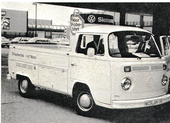
Fig. 1 VW-Elektrotransporter

Der Wirkungsgrad der Zn/O 2 -Batterie, der zurzeit bei 40 % liegt, muss aber noch wesentlich verbessert werden, und die Betriebstemperatur von 300° für die Na/S-Batterie dürfte von der Anheizenergie bis zum Crash-Test noch diverse Probleme bringen.