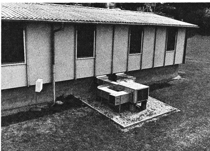
Fig. 1 Banc d'essai des pompes à chaleur de l'EPFL