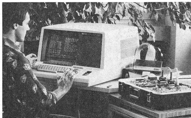
HP 64000 Logik-Entwicklungsplatz mit Intel 8080 Emulator

Der kürzlich vorgestellte Entwicklungsplatz HP-64 000 von Hewlett-Packard kann als universelles Logik-Entwicklungssystem bezeichnet werden, da er nicht auf eine bestimmte Mikroprozessorfamilie zugeschnitten ist, sondern sowohl Intel 8080/8085, Motorola 6800 als auch Zilog Z 80 unterstützt, und dies ohne Einschränkung für 16-bit- und 32-bit-Prozessoren. Sein Basissystem besteht aus einem Entwicklungsplatz mit Plattenspeicher und Drucker. Der grosse Plattenspeicher (20 M byte) bietet Platz sowohl für ein besonders leistungsfähiges Betriebssystem als auch für umfangreiche Benutzer-Files. Bis zu 6 Entwicklungsplätze