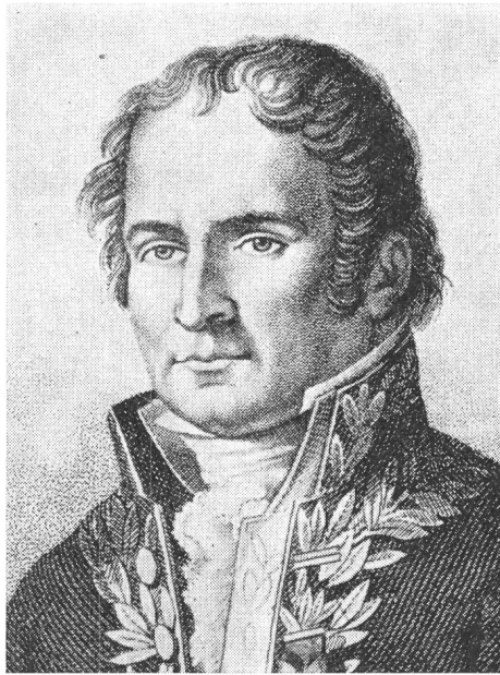
Bibliothek der ETH Zürich

Es bedrückte Fourcroy sehr, dass es ihm trotz vieler Einsprachen nicht gelang, seinen Freund Lavoisier zu retten;