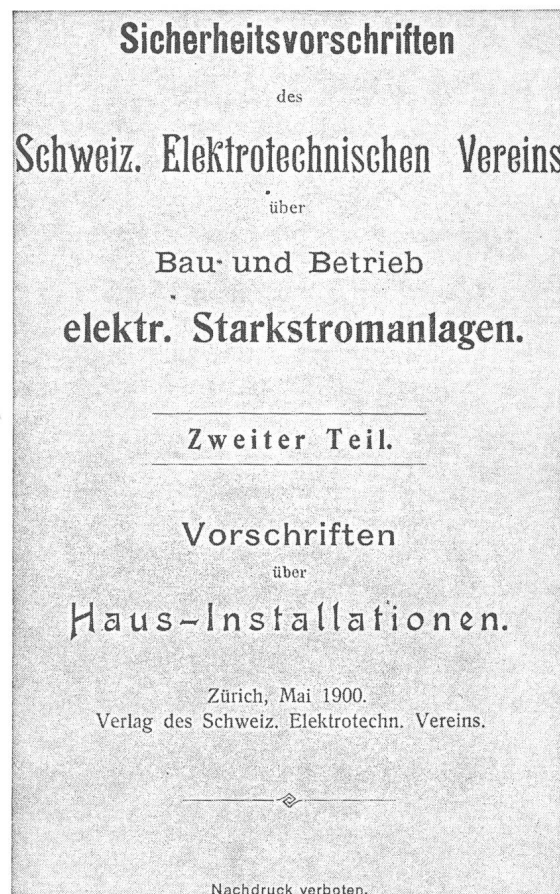
Fig. 2 Die noch vor dem Elektrizitätsgesetz erlassenen ersten Hausinstallationsvorschriften des SEV

Anders verhält es sich, wenn der Gesetzgeber direkt auf konkrete (Verbands-) Normen verweist; dies erscheint ganz besonders dann unzulässig, wenn sich der direkte Verweis auf undatierte Verbandsnormen bezieht, also «dynamisch» ist. Bei der dynamischen Verweisung besteht überhaupt keine Gewähr mehr dafür, dass in Zukunft der private Normgeber nicht gegen das dem Gesetz zugrundeliegende Gedankengut «normiert» und damit jene Normen ändert, die seinerzeit notwendiges tat-