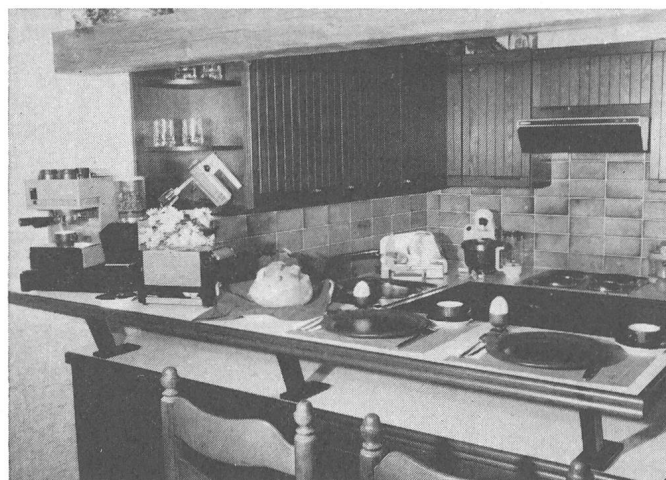
Fig. 3 ... et une cuisine moderne avec de nombreux appareils électriques

boration des normes a eu lieu à Paris en 1964. A la suite de cette conférence, le comité de l'ISO s'occupant des marques indiquant la conformité avec les normes (ISO/TC 73) a élargi son champ d'activité pour couvrir les divers moyens d'aider les consommateurs à bénéficier de la normalisation. En 1968 un Comité d'orientation de la normalisation internationale pour les questions de consommation (ISCA) a été créé par l'ISO et la CEI. Il comprend en plus des fondateurs des représentants du IOCU. A l'initiative de l'ISO/TC 73 un forum consacré aux «normes de biens de consommation aujourd'hui et demain» a eu lieu à Londres en septembre 1976. Un Suisse y participait. Les thèmes portés à l'ordre du jour montrent l'ampleur du problème: