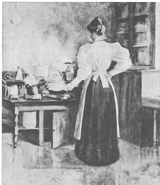
Fig. 2 Une cuisine électrique d'antan ...