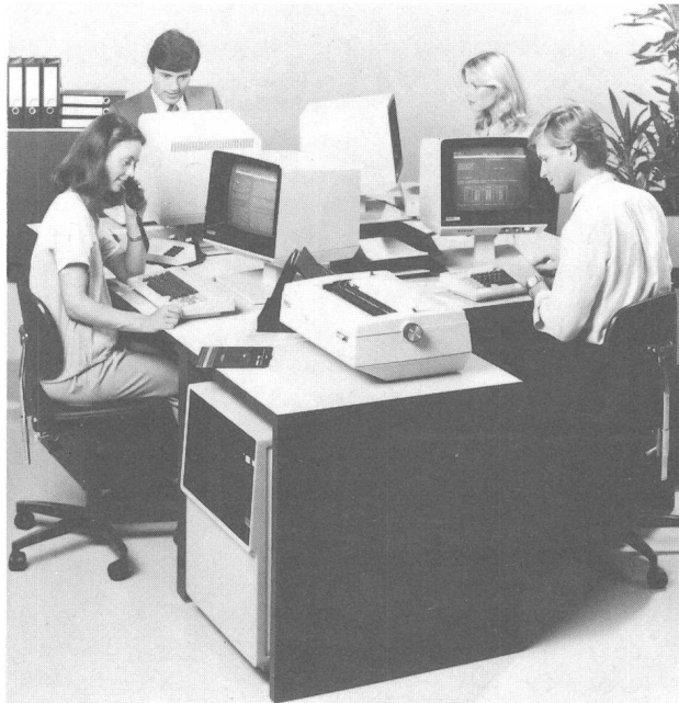
Fig. 2 Mehrplatz-Bildschirmtextsystem

Der Beurteilung dieser Frage wird seit Jahren grösste Beachtung geschenkt, besonders in Gross- und Mittelbetrieben. Da die umfassende Verwirklichung nicht vorbehaltlos durchzuführen ist, werden Teillösungen angestrebt, die dem Endausbau nicht im Wege stehen und als vollwertige Bau-