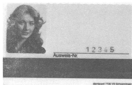
Fig. 3 Muster eines Ausweises