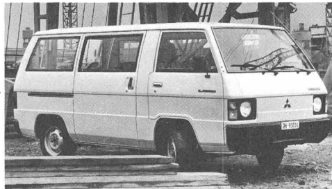
L 300. Als Chassis/Kabine, Brückenwagen, Kastenwagen, Kombi und Bus mit Benzinmotor.

Mitsubishi L300 ab Fr. 14 170.- bis Fr. 17 970.-