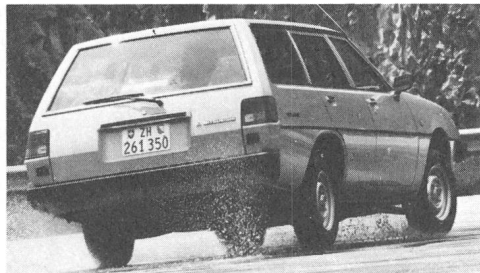
Mitsubishi Galant Kombi. Mit Benzin- oder Turbo-Dieselmotor.

Mitsubishi Galant Kombi ab Fr. 16 470.- bis Fr. 20 470.-