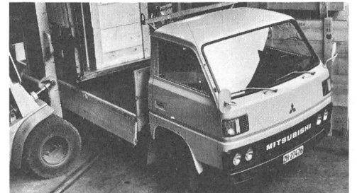
Canter. Mit 3,5 t und 5,5 t Gesamtgewicht, mit 2 Radständen, mit Benzin- oder Dieselmotor.

Mitsubishi Canter ab Fr. 22 990.- bis Fr. 28 290.-