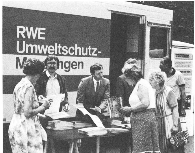
Fig. 3 Angeregte Diskussion bei einem Ausstellungsstand

Das RWE hat seine Informationszentren an den Kraftwerksstandorten mit interaktiven Exponaten ausgestattet, die die Besucher, die zum grossen Teil aus dem Ruhrgebiet anreisen, in besonderem Masse ansprechen, teilweise sogar zum «Spielen» einladen. Das Bild zeigt den Energieglobus, der die Energieversorgungslage der Länder dieser Erde, unterstützt durch Dias, darstellt.