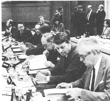
Fig. 1 Gutbesuchte Pressekonferenz

Bei diesen wichtigen Multiplikatoren geht es vorrangig um Vermitt-