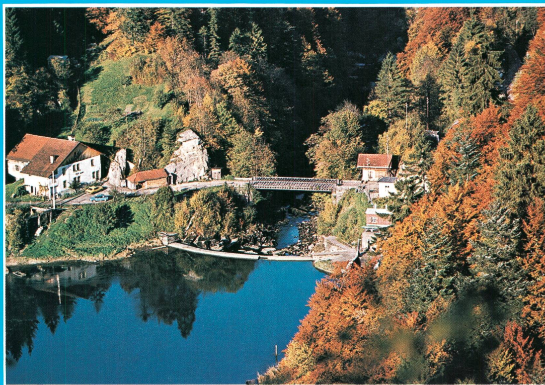
Stausee des Doubs bei la Goule

des Verbandes Schweizerischer Elektrizitätswerke de l'Union des Centrales Suisses d'Electricité