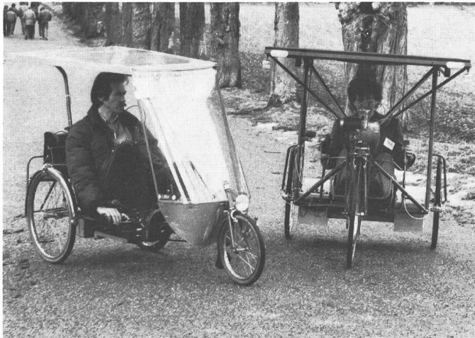
Fig. 4 Zwei der in der Schweiz gebauten Solarmobile. Links das «Solarfahrrad» und rechts das Versuchsfahrzeug der Jenni Energietechnik AG