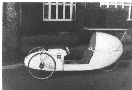
Fig. 2 Englischs Solarmobil mit zusätzlichem Pedalantrieb

In einigen Wochen zählen diese Fahrzeuge schon zur ersten Genera-