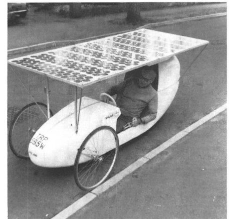
Fig. 3 Dasselbe Solarmobil in einer Variante ohne Zusatzantrieb