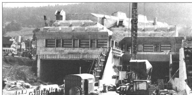
Tunnel-Rohbau Seite Weiningen mit später bepflanzttem Lärmschutzwall

Dank der vorzüglichen Zusammenarbeit zwischen den Mitarbeitern der Elektrowatt Ingenieurunternehmung AG und den Brugger Fachleuten, konnte die Kabelanlage zum gesetzten Termin fertiggestellt werden.