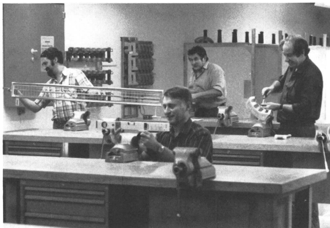
Diese Kursteilnehmer an einem BKW-internen Fachseminar haben offensichtlich viel Spass am neuen Schulungszentrum

Für längerdauernde Kurse sind im neuen Wohnpavillon acht Zimmer mit vierzehn Betten eingerichtet worden. Das leerstehende Wasserschloss ist für die abendliche Freizeitgestaltung umgebaut worden, und es kann auch für private Zwecke gemietet werden. We