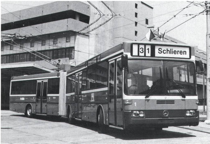
Fig. 1 Gelenktrolleybus 0405 GTZ der VBZ (Prototyp)

Steuerung gewählt. Sie ist der Druckluft-Betriebsbremse vorgeschaltet und erlaubt ein Abbremsen des Fahrzeuges praktisch bis zum Stillstand. Diese Art Bremse ergibt einen vom Traktionskreis völlig getrennten Bremskreis sowie ein Minimum von Umschaltkontakten. Sie hat sich seit Jahren nicht nur bei Dieseln, sondern auch bei Trolleybussen bestens eingeführt. Die Hilfsbetriebsgruppe (10) besteht aus einem Elektromotor mit einer Stundenleistung von 16 kW/600 V zum Antrieb des Kompressors, der Wasserpumpe und der Lichtmaschine mittels Keilriemen. Der Apparatkasten (12) enthält die 600-V-Apparate zur Steuerung der Hilfsbetriebsgruppe und des elektrischen Heizgerätes sowie das 24-V-Tableau des Bordnetzes.