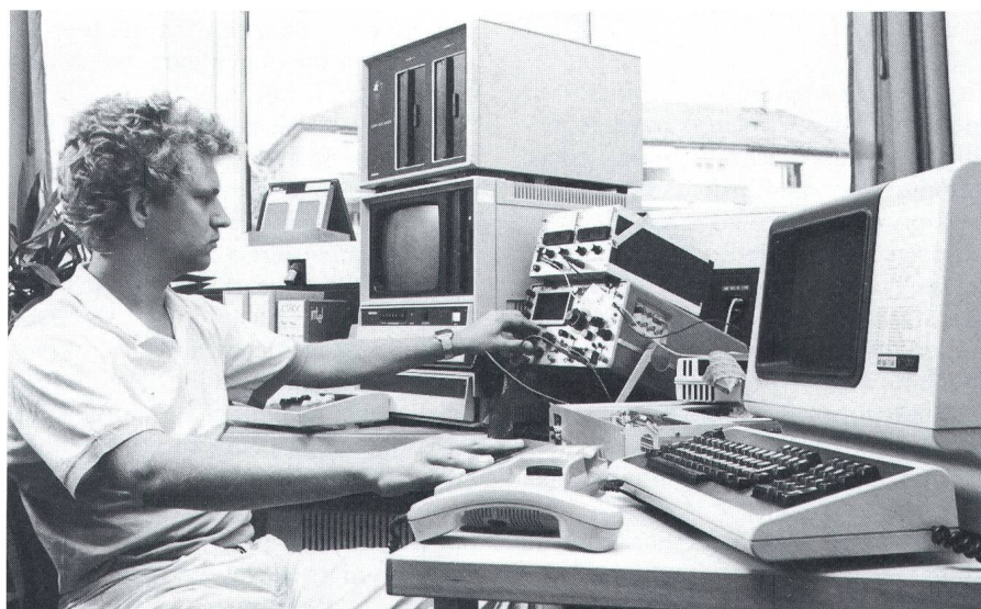
Figur 3. Werden die Ziffern des Telefonapparates von der Software richtig erkannt?

Ingenieuren, welche neu in ein Projektteam integriert werden, bietet das