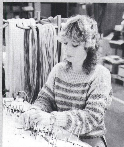
Herstellung von Kabelsätzen

Die Max Hauri AG besitzt die Generalvertretung für die Schweiz von namhaften europäischen Herstellern. Das Verkaufsprogramm umfasst über 5000 Artikel vorab für die Installationstechnik, insbesondere für die Beleuchtung. Wer weiss schon, dass die Weihnachtsbeleuchtung der Zürcher Bahnhofstrasse ein Werk der Firma Max