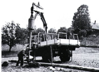
Erdbohrgerät im Einsatz