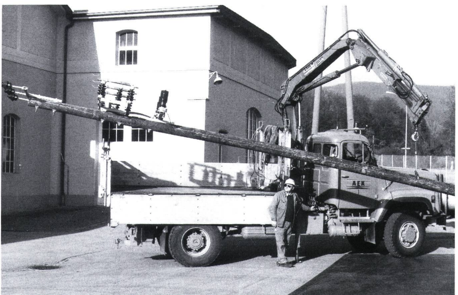
Figur 2 Auflad eines fertig ausgerüsteten Schaltermastes.