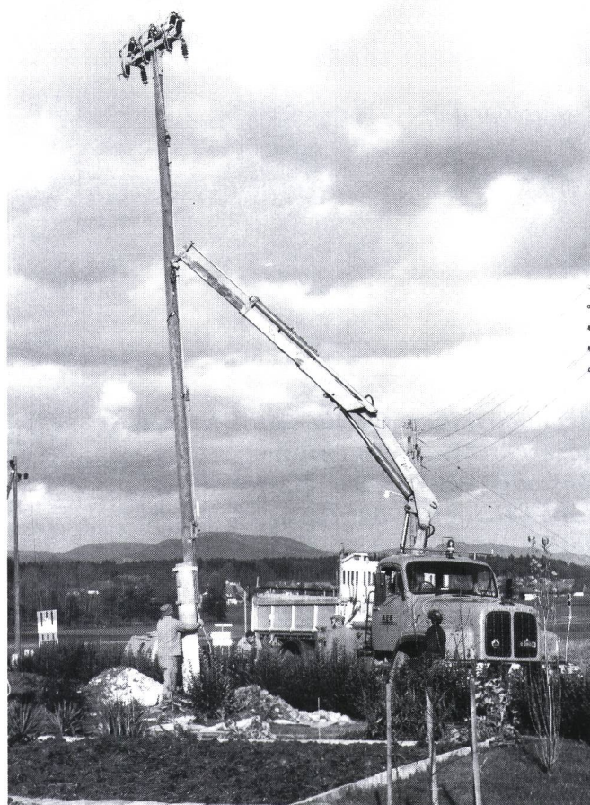
Figur 3 Stellen eines Schaltermastes mittels Lastwagen und Kran. Ohne Kran wären für diese Arbeit 6 Monteure notwendig (Zeitaufwand ohne Transport 1 Std.). Mit Kran bewältigen 3 Mann diese Arbeit in 10 Minuten.

Mittels des Seilspills werden jährlich etwa 15 km Kabel eingezogen. Auch hier hat sich die Zugkraft im Verhältnis zum Wagengewicht als günstig erwiesen. Für Kabelzüge ist nur in seltenen Fällen eine höhere Zugkraft erforderlich, was meistens mit Grossanlagen verbunden ist, wofür spezielle Geräte von den Kabelwerken zur Verfügung gestellt werden. Die durchschnittliche Nutzlast pro Fahrt beträgt etwa 1,5 Tonnen. Während der Betriebszeit von sechs Jahren hat der Lastwagen bereits 4000 Betriebsstunden und 100 000 Fahrkilometer im störungsfreien Betrieb geleistet. Auch die aufgebauten Aggregate arbeiteten bisher störungsfrei. Ein wesentlicher Beitrag zur Verfügbarkeit