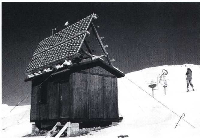
Figur 1 Photovoltaikanlage mit einer Spitzenleistung von 1,2 kW

Neben reinen Forschungszwecken dient die Anlage der Elektrizitätsversorgung einer meteorologischen Station im Süden der Schweizer Alpen. Im Hintergrund sind die Meteomasten mit den Messfühlern zu erkennen. In der Baracke befinden sich ein Batteriespeicher sowie umfangreiche elektronische Einrichtungen und Datenerfassungssysteme. Die abgebildete Anlage stellt zurzeit die grösste Forschungsanlage dieser Art in den Schweizer Alpen dar.