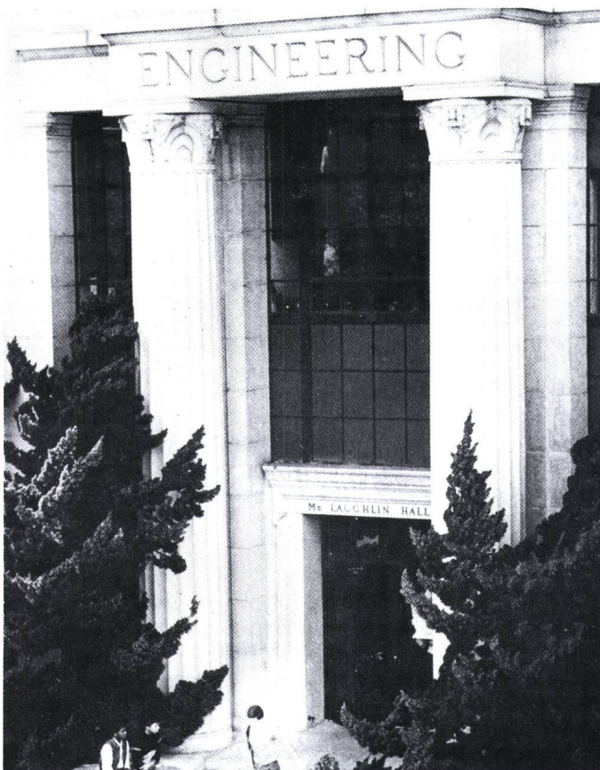
Figur 2 Spätklassizistischer Baustil