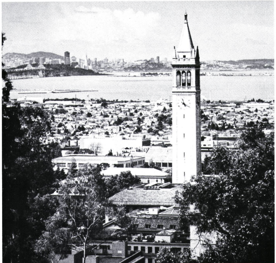
Figur 1 Blick auf die University of California. Im Hintergrund die Skyline von San Francisco

Das Alter des Lehrkörpers ist in den Staaten im Durchschnitt jünger als in der Schweiz, was sicher ein Zeichen für eine unterschiedliche Nachwuchsförderung ist. Im Gegensatz zur Schweiz ist in den Staaten eine akademische Berufung direkt nach der Dissertation keine Seltenheit. Der Vorteil dieser amerikanischen Methode zeigt sich in einer unkonventionelleren und dynamischeren Forschung sowie einer intensiveren Kommunikation zwischen Student und Lehrer. Andererseits fehlt dem amerikanischen Kollegen oft die (praktische) Erfahrung.