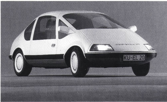
Figur 1 Der Pöhlmann EL (BRD)