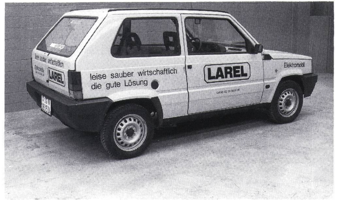
Figur 2 Der Larel (Schweiz)

Schlüsselbereiche und vergibt Entwicklungs- und Demonstrationsaufträge hauptsächlich an grosse Unternehmen. So beendete 1985 die Firma Ford einen solchen Vertrag durch die Herstellung des ETX I Elektroautos, das jedoch eher als Nachweis der Machbarkeit des Wechselstromantriebs angesehen werden muss denn als Prototyp eines Elektropersonenwagens.