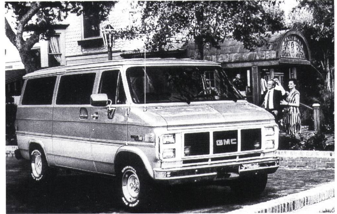
Figur 5 Der Elektrotransporter «G-van» von General Motors (USA)

Firma Eagle Picher ausgewählt, obwohl dieses Programm noch nicht das Prototypen-Stadium erreicht hat. Zu den weiteren amerikanischen Nutzfahrzeug-Projekten, die vom amerikanischen Departement of Energy finanziert werden, gehört der Ford «ETX-II Aerostar van», der als Basis-Testfahrzeug für den heute verfügbaren Wechselstromantrieb dienen wird sowie für Natrium-Schwefel-Batterien, die von Chloride Silent Power Ltd. geliefert werden. ETX bedeutet electric transaxle. Ein weiteres Projekt, das von der Eaton Corporation in den USA entwickelt wird, beinhaltet ein elektrisches Antriebssystem mit Doppelwelle (dual-shaft electric propulsion, DSEP).