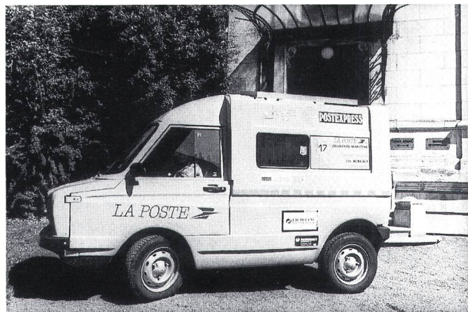
Figur 4 Der Volta-Kastenwagen (Frankreich)