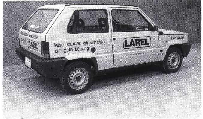
Figur 2 Der Larel (Schweiz)

Schlüsselbereiche und vergibt Entwicklungs- und Demonstrationsaufträge hauptsächlich an grosse Unternehmen. So beendete 1985 die Firma Ford einen solchen Vertrag durch die Herstellung des ETX I Elektroautos, das jedoch eher als Nachweis der Machbarkeit des Wechselstromantriebs angesehen werden muss denn als Prototyp eines Elektropersonenwagens.