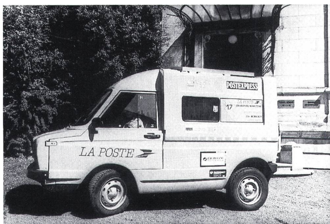
Figur 4 Der Volta-Kastenwagen (Frankreich)