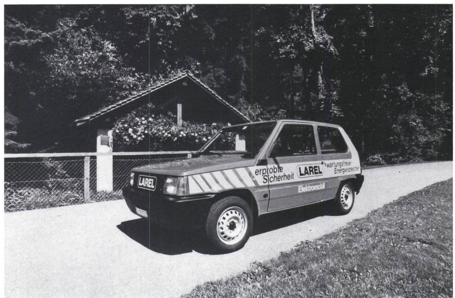
Figure 1 La voiture électrique Larel

La Larel, qui atteint facilement 80 km/h au plat, provient de la transformation d'une Fiat Panda. La partie «essence» étant enlevée, le moteur électrique de 15 kW, le chargeur de