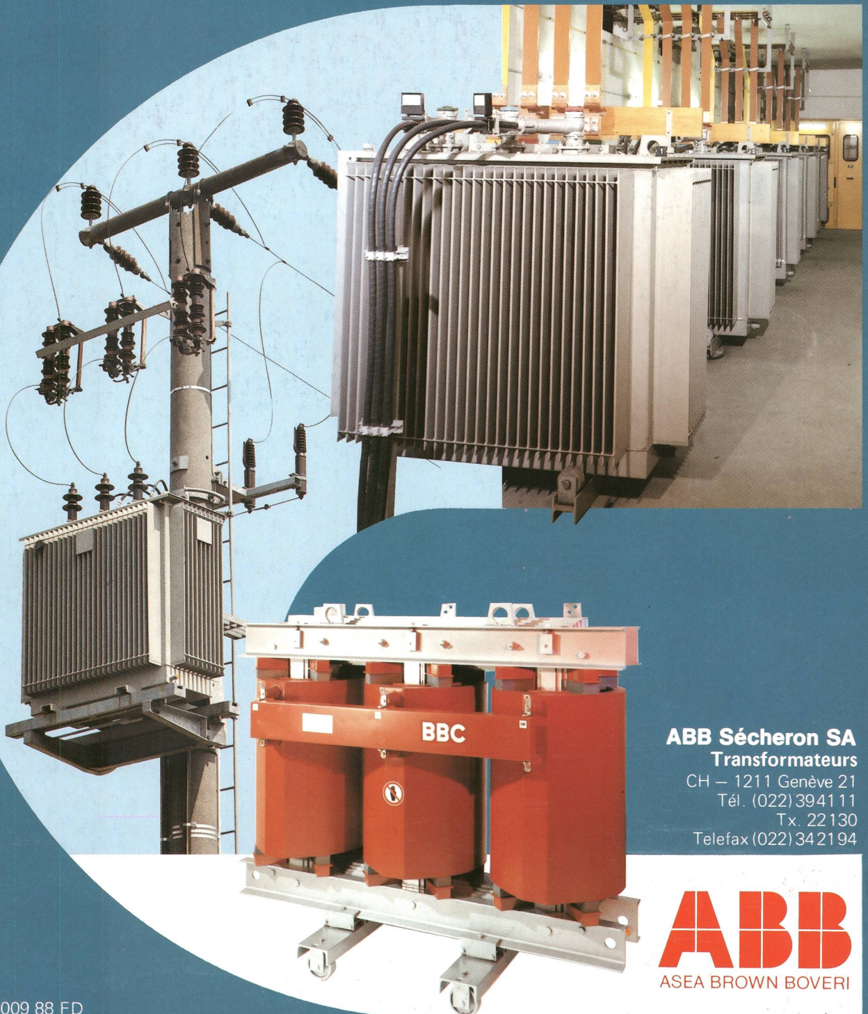
ABB Sécheron SA Transformateurs

CH — 1211 Genève 21 Tél. (022) 3941 11 Tx. 22 130 Telefax (022) 34 21 94