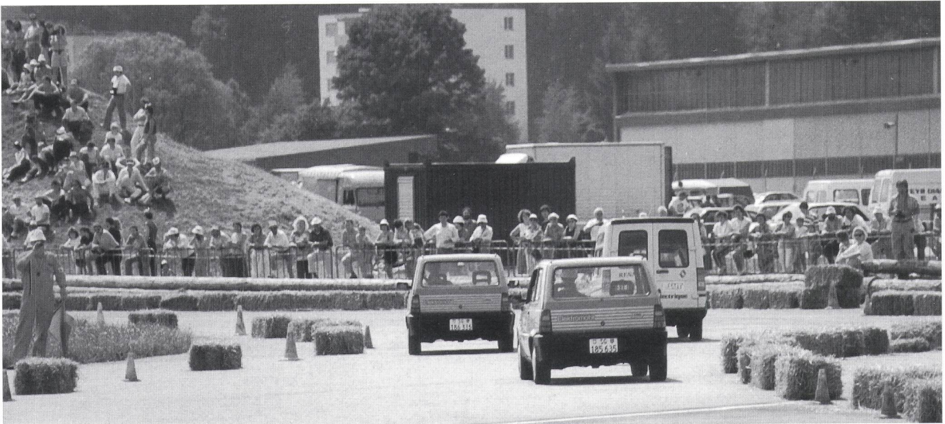
Rennatmosphäre auf dem Parcours in Emmen.