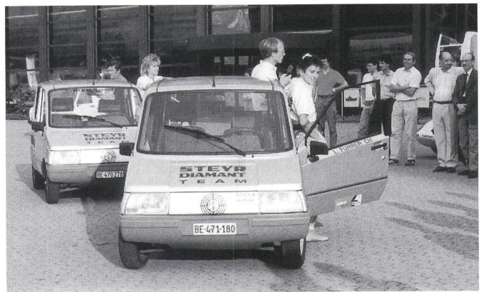
Das Steyr-Diamant-Team bei der Präsentation im Verkehrshaus.