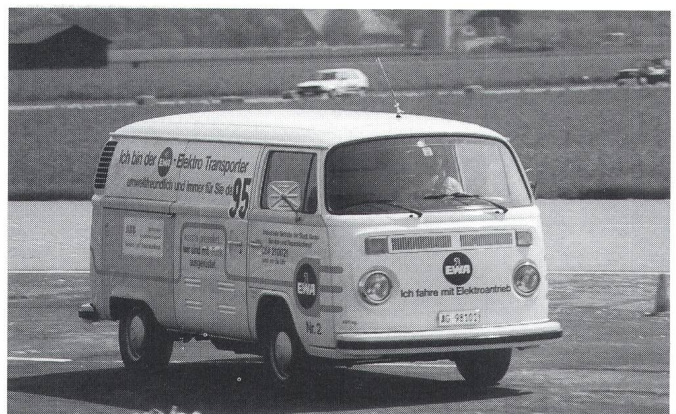
Der bereits seit Jahren im Alltagsinsatz stehende VW-Transporter des EWs Aarau konnte sich erneut ausgezeichnet plazieren.