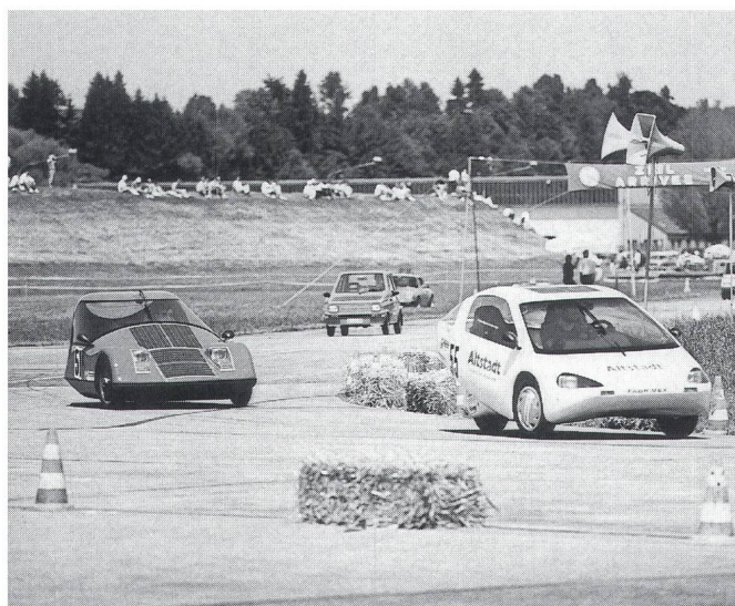
Das Rennsolarmobil der Ingenieurschule Biel verfolgt einen Elektro-Kart des Elmo-Karting Clubs, Zuchwil.