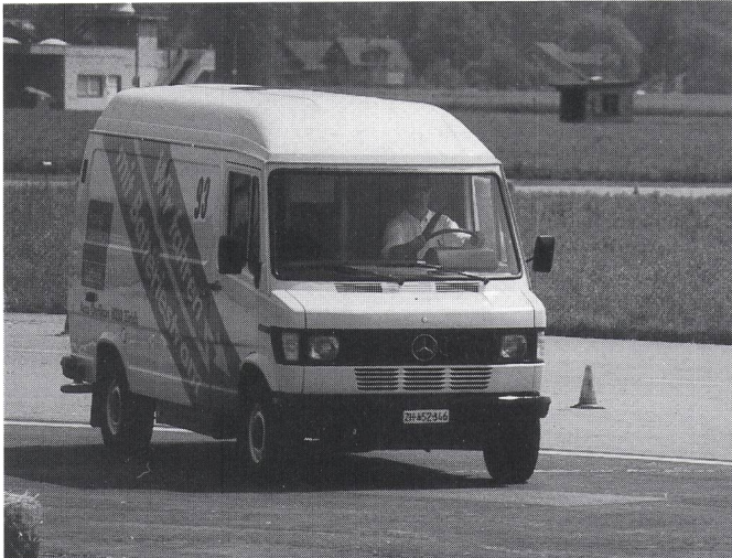
Ebenfalls ein bei den Grand-Prix-Formel-E-Veranstaltungen bestens bekannter Teilnehmer ist der Elektro-Mercedes-Transporter der Accu Oerlikon.