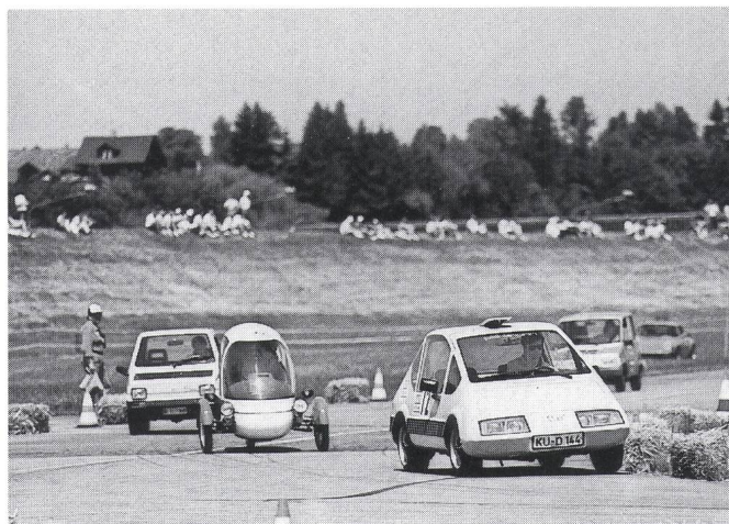
Verschiedene leichte Elektromobile der Kategorie Prototypen und Markenfahrzeuge im Duell.