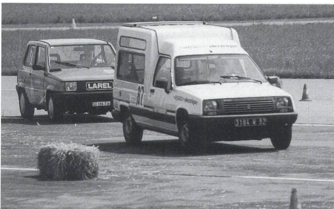
Der Renault Express wird von einem Larel verfolgt.