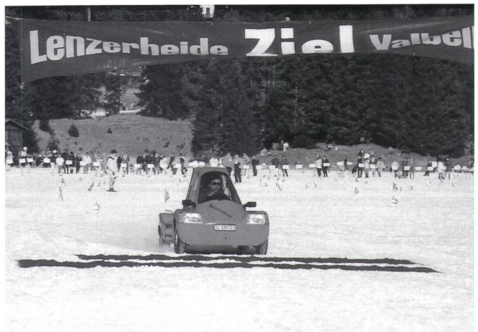
Der Sieger der Kategorie Prototypen, Markus Eisenring, mit seinem Eigenbau «Stromboli»

che, dass nur 12 Solarmobile, 5 Prototypen und 7 Seriensolarmobile zu dieser Prüfung antraten. Am ersten Tag galt es, eine 4 Kilometer lange Bergfahrt mit einer Höhendifferenz von 334 m auf weitgehend schneefreier Strasse zu bewältigen. Alle Fahrzeuge schafften dies ohne grössere Probleme, wobei die Fahrzeiten mit einer Aus-