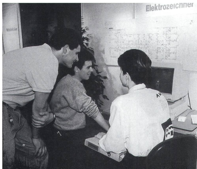
Eine Elektrozeichnerin erläuterte den Interessierten die Funktionsweise des Computer Aided Design (CAD).