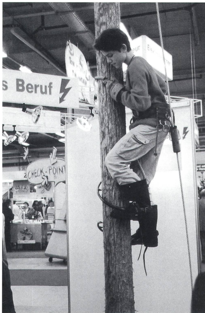
Eine ausgesprochene Attraktion war der Leitungsmast, an dem Mutige beiderlei Geschlechts ihre Kletterkünste unter Beweis stellen konnten.

«Spannung als Beruf» – unter diesem Motto stand der erste Gemeinschaftsstand des Verbandes Schweizerischer Elektro-Installationsfirmen (VSEI) und des Verbandes Schweizerischer Elektrizitätswerke (VSE), der dieses Jahr anlässlich der MUBA Sonderschau Dein Beruf – Deine Zukunft für die drei Elektroberufe Elektromonteur, Elektrozeichner und Netzelektriker warb. Schwerpunkte des Standes bildeten die Demonstration praktischer Arbeiten, die Vorführung eines CAD-Arbeitsplatzes mit Plotter, Personenschutz- und Brandschutzversuche sowie eine Videoshow. Zu einer ausgesprochenen Attraktion entwickelte sich aber ein in der Halle aufgestellter Mast, an dem Mutige beiderlei Geschlechts ihre Kletterkünste unter Beweis stellen konnten. Einen weiteren Hauptanziehungspunkt bildete ein Glücksrad, an dem die Interessenten nach richtiger Beantwortung von sechs Wettbewerbsfragen einmal drehen durften und dabei mit etwas Glück attraktive Preise gewinnen konnten. Nicht weniger als 5000 Teilnehmer versuchten bei diesem Wettbewerb ihr Glück und beantworteten die Fragen über die Haupttätigkeiten der drei vorgestellten Elektroberufe.