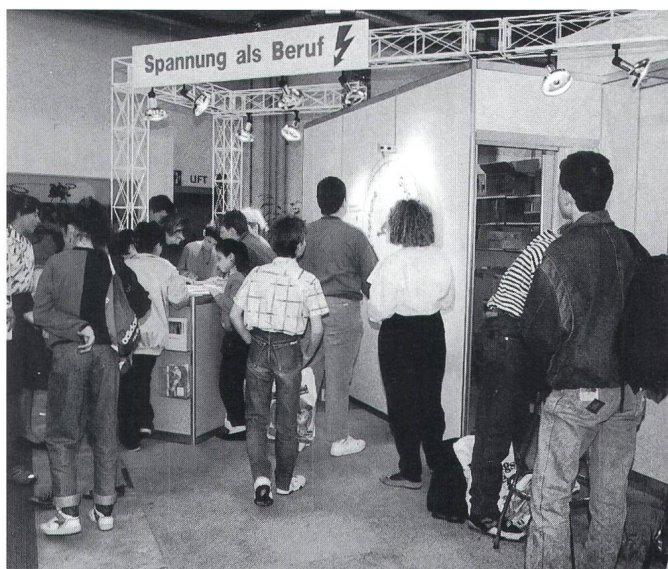
Bei einem Wettbewerb konnten attraktive Preise gewonnen werden. Des prix intéressants ont pour ainsi être gagnés lors d’un concours.

«La tension comme profession» – tel a été le slogan du stand commun de l’Union Suisse des Installateurs-Electriciens (USIE) et l’Union des Centrales Suisses d’Electricité (UCS) dans le secteur Ta profession – ton avenir à la foire aux échantillons (MUBA) de Bâle. Le stand avait pour but de faire mieux connaître les trois professions de monteur-électricien, dessinateur d’installations électriques et électricien de réseau. On pouvait y voir la démonstration de travaux pratiques, la présentation d’une place de travail CAD avec traceur, des tests de protection des personnes et contre les incendies ainsi qu’un film vidéo. La véritable attraction a toutefois été le poteau installé dans la salle d’exposition, poteau sur lequel tous les jeunes courageux, aussi bien filles que garçons, ont pu faire preuve de leurs talents d’escaladeurs. La roue de la Fortune était une autre attraction. Pour avoir une fois la possibilité de la faire tourner et gagner ainsi, avec un peu de chance, des prix intéressants, les intéressés ont d’abord dû répondre correctement aux six questions du concours. Pas moins de 5 000 participants ont tenté leur chance à ce concours en répondant aux questions sur les principales ac-