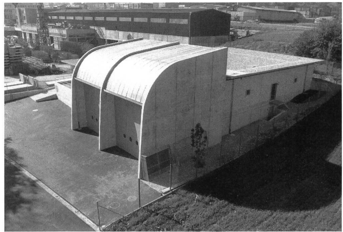
Betriebsgebäude mit eingebauten Traforäumen (Nordansicht)

Eigentlich hätte das neue Unterwerk in der Hülften stehen sollen, jedoch zeigte es sich, dass heute Ausnahmegewilligungen für Bauten ausserhalb der Bauzone praktisch nicht mehr erhältlich sind. Wegen der Dringlichkeit des Bauvorhabens musste ein anderer Standort gesucht werden. Dank der Hilfe des Kantons konnte schliesslich eine Bauparzelle in Füllinsdorf gefunden werden, welche ca. 700 m vom ursprünglich geplanten Standort entfernt ist. Im April 1989 wurde die Baubewilligung erteilt, worauf im Mai der erste Spatenstich erfolgte. Bereits im November war der Rohbau fertiggestellt, und die Innenausbauarbeiten konnten in Angriff genommen werden.