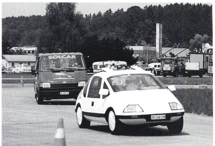
Auch am 6. Internationalen Grand Prix Formel E, vom 24. und 25. Mai 1991 in Emmen, wird es – dank internationaler Beteiligung – wieder spannende Rennszenen geben

Anfragen zu diesem Anlass sind an die ACS-Zentralverwaltung, Wasserwerksgasse 39, 3000 Bern 13, zu richten.