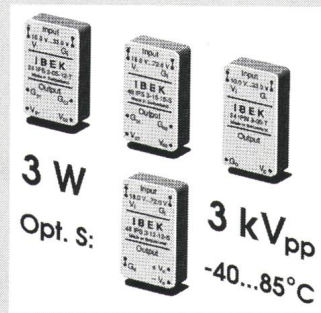
3 W/3 kVpp DC-DC-Konverter

Gehäuse mit einer Höhe von nur 10,5 mm mehr als hundert verschiedene Standardtypen. Die