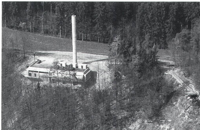
Das Deponiegas-Kraftwerk Teufthal hat im ersten Betriebsjahr rund 12 Mio. kWh Strom aus Biomasse erzeugt

Infolge trockener Witterung reichte die produzierte Gasmenge während vier Monaten lediglich für drei Verstromungsaggregate aus. Nach den starken Regenfällen im Herbst 1990 stieg der Schadstoffgehalt im Deponiegas derart stark an, dass die Anlage ganz abgeschaltet werden musste und erst ab Mitte November erneut mit Vollast gefahren werden konnte. PS