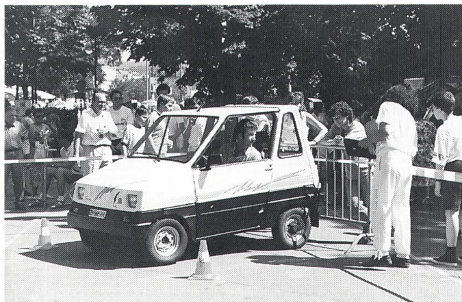
Beim Geschicklichkeitsfahren kam es auf den Zentimeter an

Den Abschluss bildete jeweils ein Wettrennen mit ferngesteuerten Modell-Solarmobilflitzern, das vor allem Jugendliche, aber auch jung gebliebene aller Altersklassen in seinen Bann zog. Ganz erstaunlich war die Vielfalt der selbstgebastelten Karosseriekonstruktionen, die aus dem jeweils gleichen Bausatz gestaltet worden waren. Die Gewinner erhielten schöne Pokale. Zusätzlich wurden Sonderpreise für ein besonders gelungenes Design der Modellfahrzeuge vergeben, die von der Informationsstelle für Elektrizitätsanwendung (Infel) gestiftet worden waren. Ps